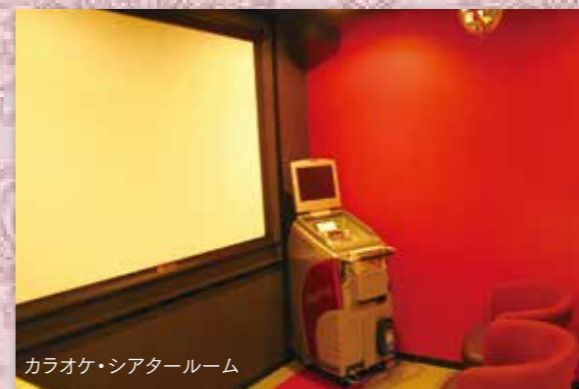
カラオケ・シアタールーム