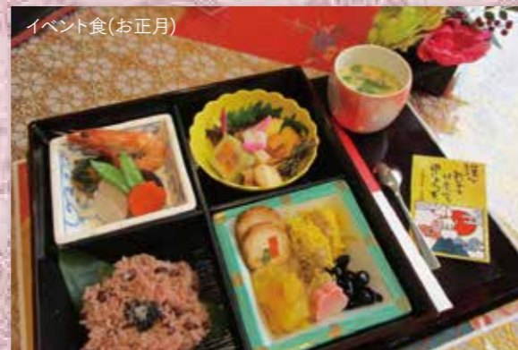
イベント食(お正月)