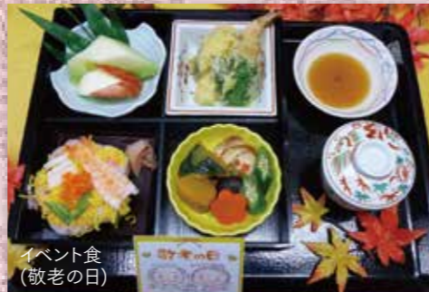
イベント食 (敬老の日)