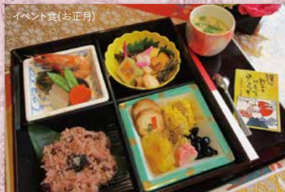
イベント食(お正月)