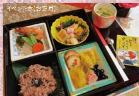
イベント食(お正月)