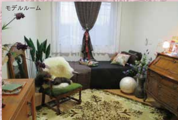
【居室の備え付け品】

・ベッド・基本寝具・洗面台・エアコン・クローゼット・照明器具 ・ナースコール・温水洗浄便座付トイレ・レースカーテン・テレビ回線