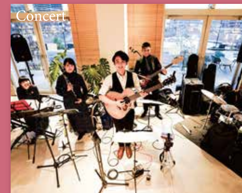
平成三十年「社内お正月コンテスト」1位受賞