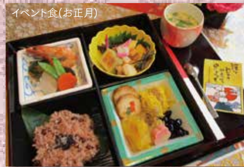
イベント食(お正月)