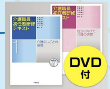
介護職員初任者研修テキスト使用 全2巻 出典 中央法規出版