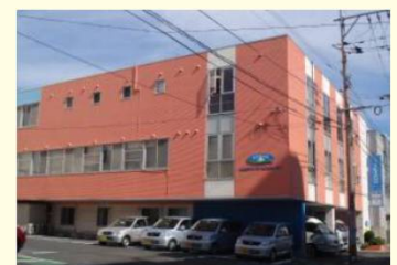
シダー本社 小文字デイサービスセンター