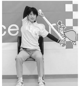
配信動画の一例、タオルを使ったストレッチを紹介

動画配信に活用するのはアグリマスが提供する介護施設に特化したプラットフォームフォームで、「動